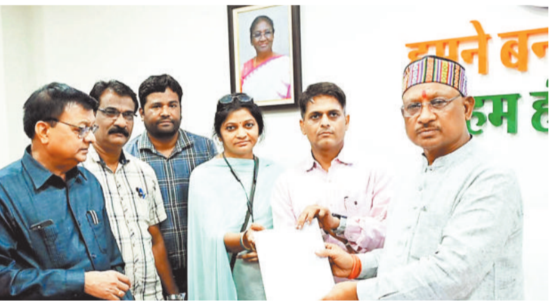
मुख्यमंत्री से मुलाकात करते उद्योग मंत्री व प्रतिनिधिमंडल।