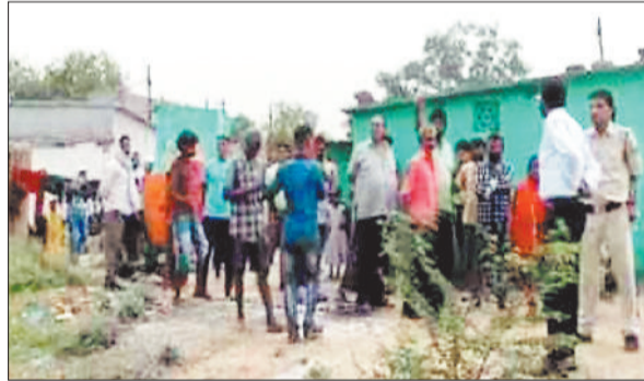
विरोध प्रदर्शन करते बस्तीवासी।

क्रमांक 25 कुंआभट्टा बस्ती में 40 से अधिक लोगों को हटाने के लिए सुपर डेवलपर्स नामक कंपनी के लोगों ने उच्च न्यायालय में याचिका दायर की थी। उच्च न्यायालय से अवैध कब्जा हटाने के आदेश पर