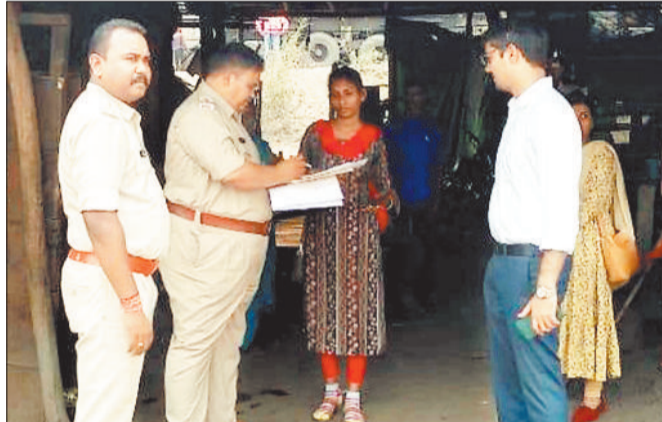
ढाबा पर कार्यवाही करती पुलिस व खाद्य विभाग की टीम।