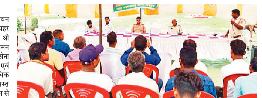
कार्यशाला में जानकारी देते अधिकारी।