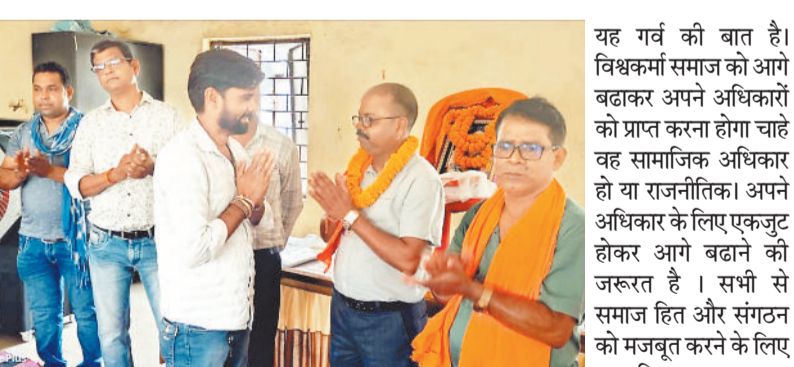
विश्वकर्मा समाज के पदाधिकारी।